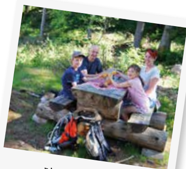
PAUSE PIQUE-NIQUE !