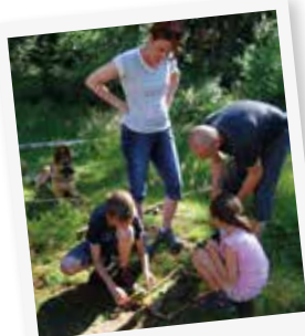
LAND'ART EN FAMILLE !